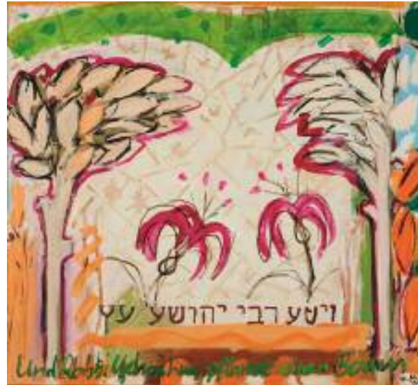
„Und Rabbi Yehoshua pflanzte einen Baum“ mit Bildzitaten aus biblischen Handschriften zu Hochzeitsmotiven.

Die bisherigen 19 Ausstellungen seit 2006 in Deutschland, Frankreich und 2008 in Israel – dem 60. Jahrestag der Gründung des Staates Israel und dem 70. Jahrestag der „Kristallnacht“ gewidmet – stellen die grundlegende Frage: „Welches Gewicht hat ein Stein, der durch das Fenster eines jüdischen Hauses geworfen wurde?“