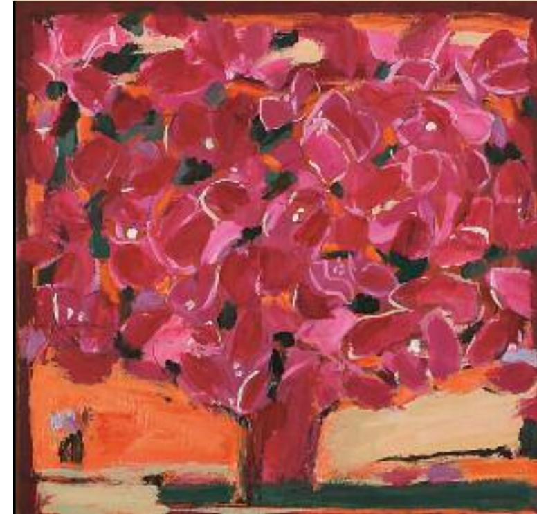
Blütenbaum aus Shavei Zion