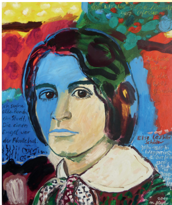
Portrait Else Lasker-Schüler