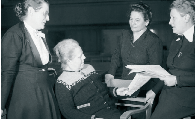
Die Mütter des Grundgesetzes 1949 (v.l.n.r.): Helene Wessel, Helene Weber, Frieda Nadig und Elisabeth Selbert

1. April bis 9. September 2019/Haus Edith Stein