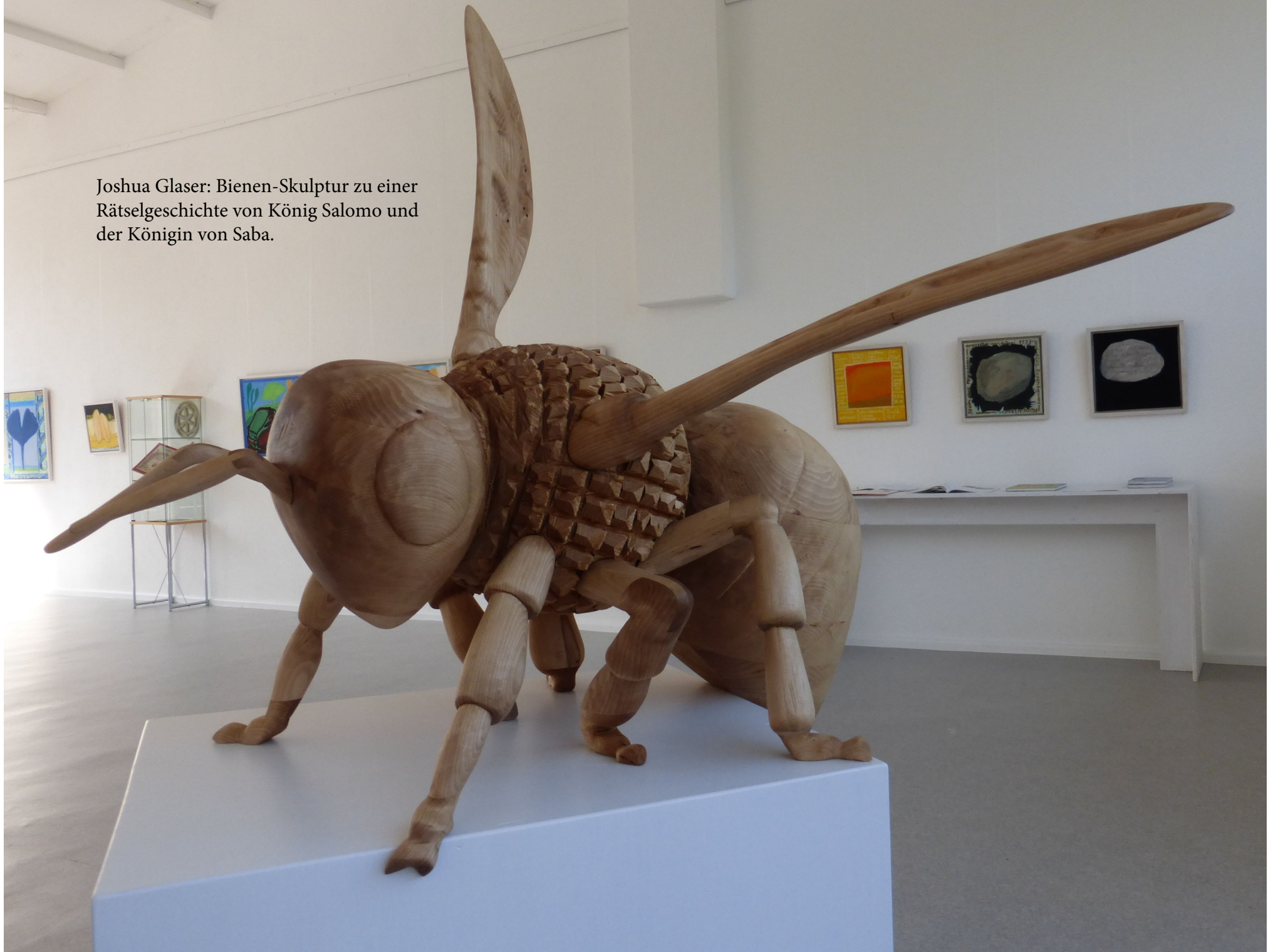
Joshua Glaser: Bienen-Skulptur zu einer Rätselgeschichte von König Salomo und der Königin von Saba.